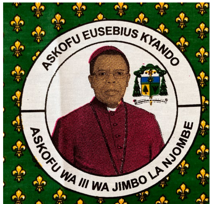
Anlässlich der Bischofsweihe wurden Stoffe mit dem Konterfei und Wappen des designierten Bischofs gedruckt. Sein Wahlspruch lautet übrigens: „In Humilitate et Mansuetudine“- „In Demut und Güte“.

Straße, die zur Kathedrale von Njombe führt, war mit mehreren tausend Menschen gesäumt, die einen Blick auf den designierten Bischof werfen wollten, bevor die Feierlichkeiten der Bischofsweihe mit einer Vesper am Vorabend begannen. Die Messe am Sonntag, zu der 34 Bischöfe, sicher mehr als 500 Priester und viele Vertreter:innen der tansanischen Zivilgesellschaft und Politik angereist waren, begann um zehn Uhr.