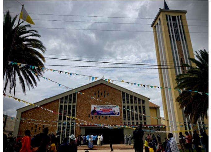
Die Kathedrale von Njombe sollte zu klein sein, um alle Menschen aufzunehmen, welche die Bischofsweihe mitfeiern wollten. Für mehr als zehntausend Menschen und eine Übertragung im nationalen Fernsehen wurde auf eine benachbarte Freifläche ausgewichen.