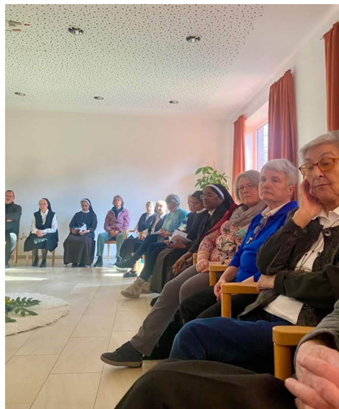
In großen und kleinen Gesprächsrunden kam ein intensiver Austausch zum Thema zustande.