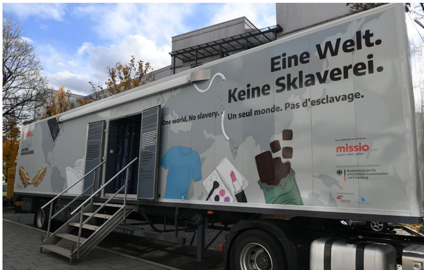
Neuer missio Truck mit dem Thema „Eine Welt – keine Sklaverei“.