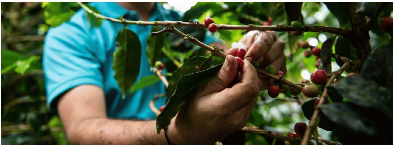
Der Bauer prüft, ob die Kaffeebohnen erntereif sind.

https://fastenaktion.misereor.de/fileadmin/user_upload_fastenaktion/08-thema/kurzgeschichte-oweimar-viveros-fastenaktion-2024.pdf