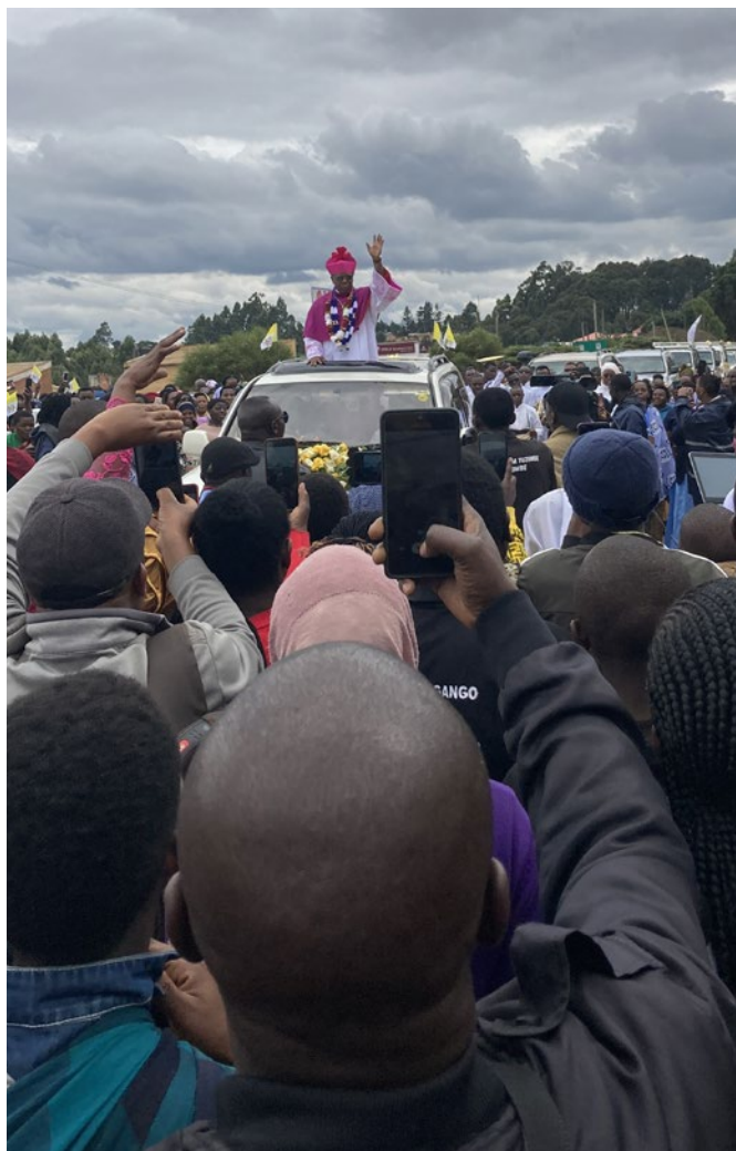
Mehrere tausend Menschen säumten den Straßenrand, während der designierte Bischof in Njombe ankommt.

Neben den offiziellen Vertreter:innen feierten zehntausend Menschen mit. Obwohl ich quasi kein konkret gesprochenes Wort verstand, da die Messe auf Kisuaheli gefeiert wurde, half mir das gedruckte Programm, den Feierlichkeiten zu folgen, bis Bischof Eusebio gegen vierzehn Uhr seinen ersten bischöflichen Segen spendete. Darauf folgten die Grußworte und Gratulationen der Offiziellen. Auch Weihbischof Schepers, der tags zuvor das 46-jährige Jubiläum seiner Diakonenweihe feiern durfte, gab Bischof Eusebio einige Gedanken mit auf den Weg. „Hole dir Rat von Menschen, die dir nicht nur nach dem Mund reden“ und „Lebe das Evangelium mit Freude“ mögen die beiden wichtigsten davon sein. Durch ein schnelles Essen gestärkt, traten wir am späten Nachmittag (aber doch viel zu früh...) den ersten Teil unserer Heimreise an. Diesmal ging es mit dem Auto in Richtung Dar-es-Salaam um von dort in der Nacht von Montag auf Dienstag bei 30 Grad zu starten und bei Temperaturen um den Gefrierpunkt im Ruhrgebiet anzukommen.