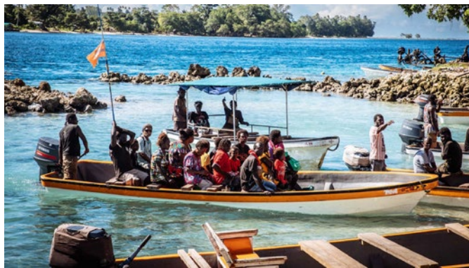
Leben auf einem Inselstaat.

Im Mittelpunkt der missio-Aktion 2024 stehen Frauen in Melanesien. Sie gestalten einen Großteil des Zusammenlebens in Familie und in der Gemeinschaft. Kirchliches Leben wäre ohne ihren Einsatz undenkbar. Doch die Teilhabe an Entscheidungen in ihren Gemeinschaften wird ihnen oft verwehrt.