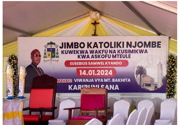
Noch war der Bischofsstuhl in Njombe leer, doch nach einer vierstündigen Messe (während der Fotografieren verboten war)...

Während dieser Text die sprichwörtlichen tausend Worte bereits überschritten hat, bleibt zu sagen, dass auch die Bilder nicht alles sagen, aber natürlich andere Eindrücke vermitteln. So kurz die Reise war, so sehr bin ich mir sicher, dass sie nachwirken wird. Die Verbindungen zwischen Essen und Njombe bleiben stark!