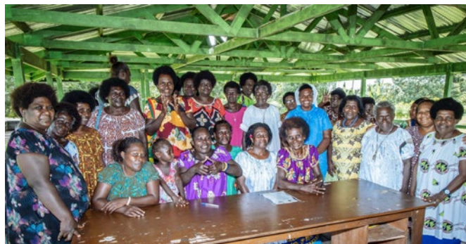
Frauengruppe auf Vanuatu

Die missio-Aktion zum Sonntag der Weltmission 2024 ruft zur Solidarität mit den Frauen in Melanesien auf. Anhand von Beispielen aus Papua-Neuguinea, den Salomonen und Vanuatu zeigt das Aktionsmaterial, wie die katholische Kirche Frauen fördert und stellt Beispiele von Frauen vor, die aus dem Glauben heraus Antwort auf die aktuellen Herausforderungen geben und ihrer Stimme Gehör verleihen.