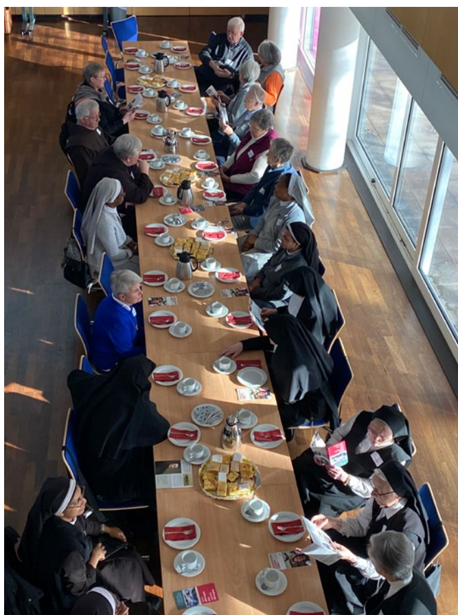
Bei Kaffee und Kuchen in der Aula des Bischöflichen Generalvikariats kamen die Ordensleute schnell ins Gespräch.