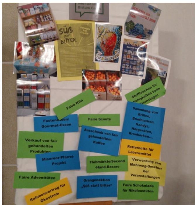
Während des Empfangs nach der Re-Zertifizierung präsentiert der Eine-Welt-Kreis auf dieser Stellwand einige Highlights des besonderen Engagements der Pfarrei.

Die Re-Zertifizierung stand an, denn das Zertifikat „ökologisch und fair im Bistum Essen“ wird nur für jeweils drei Jahre vergeben. In diesen drei Jahren soll nicht nur der Stand des besonderen Engagements für Nachhaltigkeit, globale Gerechtigkeit, fairer Handel und Schöpfungsbewahrung gehalten werden. Vielmehr soll das Engagement weiter ausgebaut werden, denn wirklich „fertig“ ist man mit der Arbeit zu diesem Themenkreis nie. Diese schwere Aufgabe haben die Menschen in St. Josef mit Bravour gemeistert. Der faire Handel bleibt ein Schwerpunkt der Eine-Welt-Arbeit auf der Ruhrhalbinsel, aber auch die seit der ersten Auszeichnung erreichten Meilensteine können sich sehen lassen. Die Pfarrzeitschrift „Jupp“ erscheint nun auf Recyclingpapier und die Pfarrei nutzt Ökostrom. Dazu einen herzlichen Glückwunsch und: weiter so!