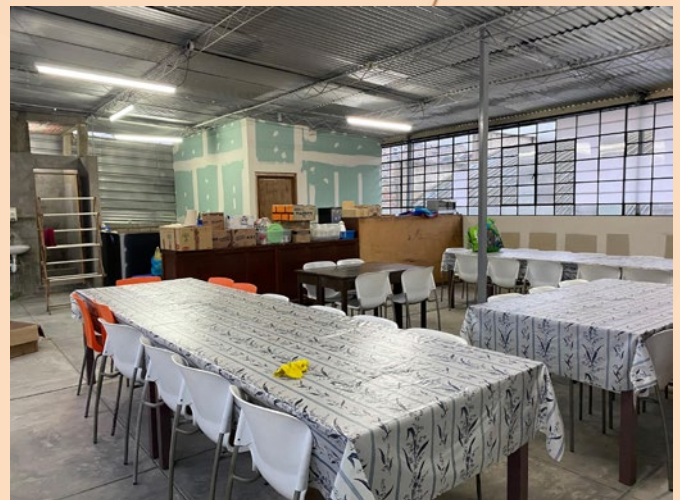
Der Hogar in Lima muss aktuell wegen eines Neubaus der Schule umziehen.

Aktuell ist die Situation des Hogars etwas schwierig, es gibt keinen Bereich, wo die Kinder draußen spielen können. Alles findet nur im obersten Stockwerk der Grundschule statt. Diesen Zustand merkt man den Kindern an, weil für sie der Ausgleich und die Bewegung fehlen.“