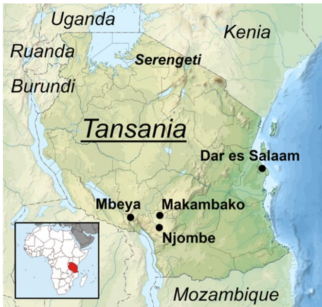
Karte von Tansania mit den wichtigsten Stationen unserer fünftägigen Reise (leider war keine Zeit für einen Besuch der Serengeti, die hier nur der Orientierung halber gekennzeichnet ist)