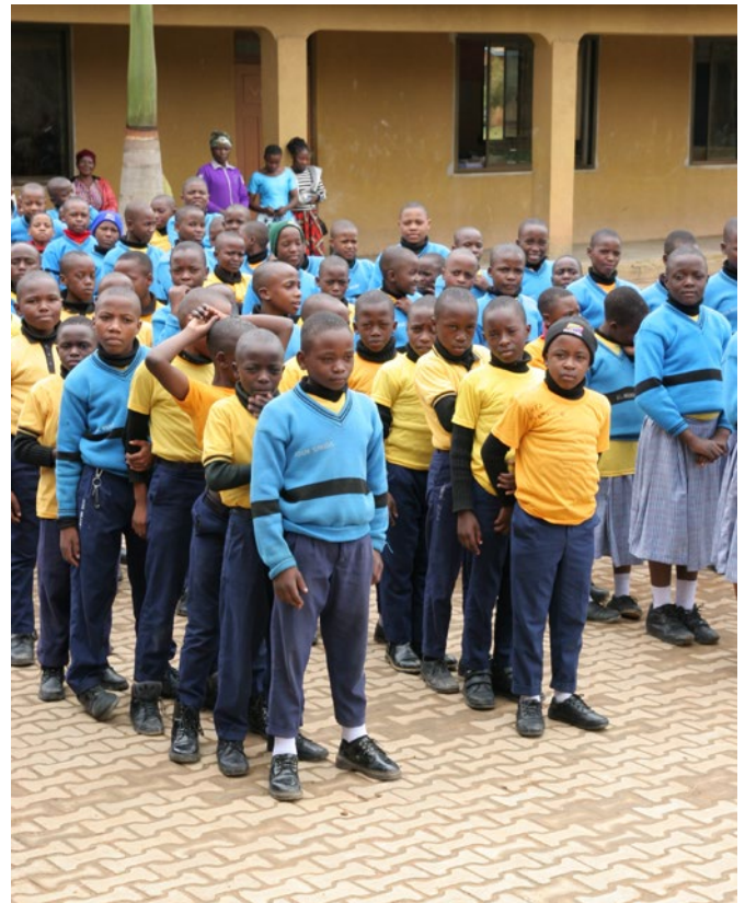
Einige Schüler:innen der Sigrid Primary School in Makambako warteten für unser Empfinden zu diszipliniert auf unseren Besuch. Die Grundschule eröffnet mehr als fünfhundert Kindern eine Chance auf Bildung. Laut Statuten müssen davon mindestens 20% Waisen sein.