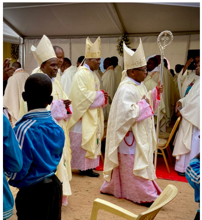
...erteilte Bischof Eusebio zum ersten Mal den bischöflichen Segen.